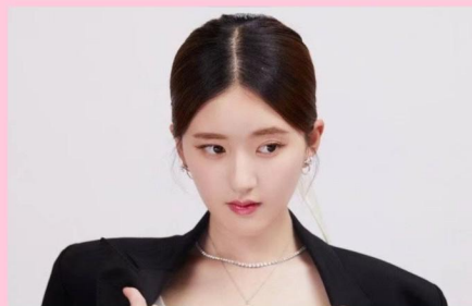
赵露思 粉丝: 1534万