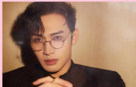
张彬彬 粉丝: 1580万