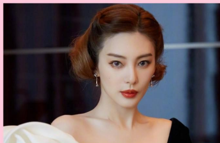
张雨绮 粉丝: 1322万