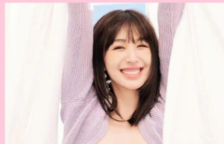
李菲儿 粉丝: 1352万