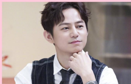
何炅 粉丝: 1亿+

节目中还将限时邀请#神秘合伙人#作为助阵大咖 他们将协助花花合伙人, 开启创业合伙人模式!