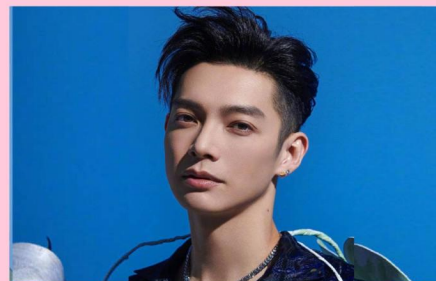
辰亦儒 粉丝: 873万