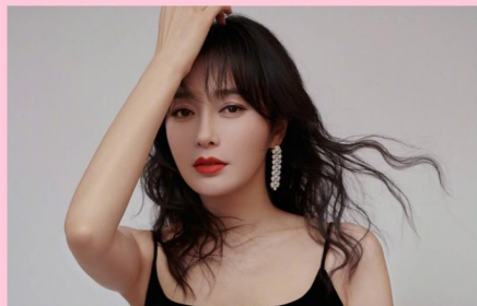
秦岚 粉丝: 1557万