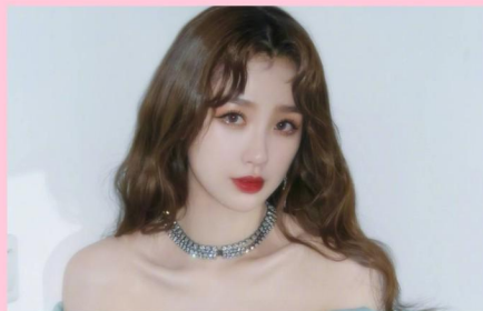
虞书欣 粉丝: 1520万